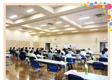
オレンジカフェしかま