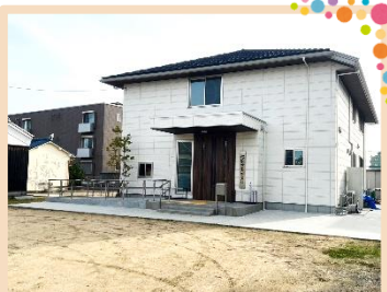
オレンジカフェ運営協議会