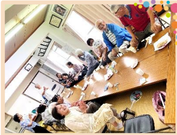
フレンド喫茶小瀬