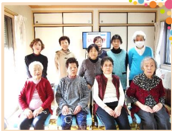
オレンジカフェひがしぼり