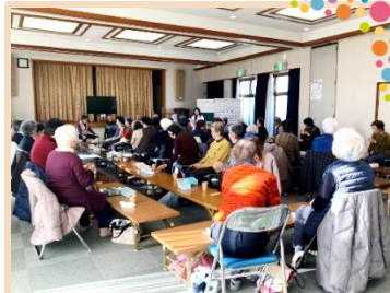
中島オレンジサロン